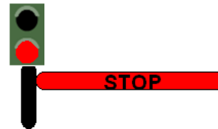
FEU ROUGE : Arrêt

Pour passer, attendez que le feu soit vert et que la barrière se lève.