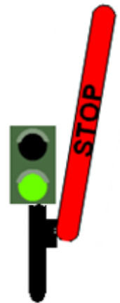
FEU VERT : Avancez